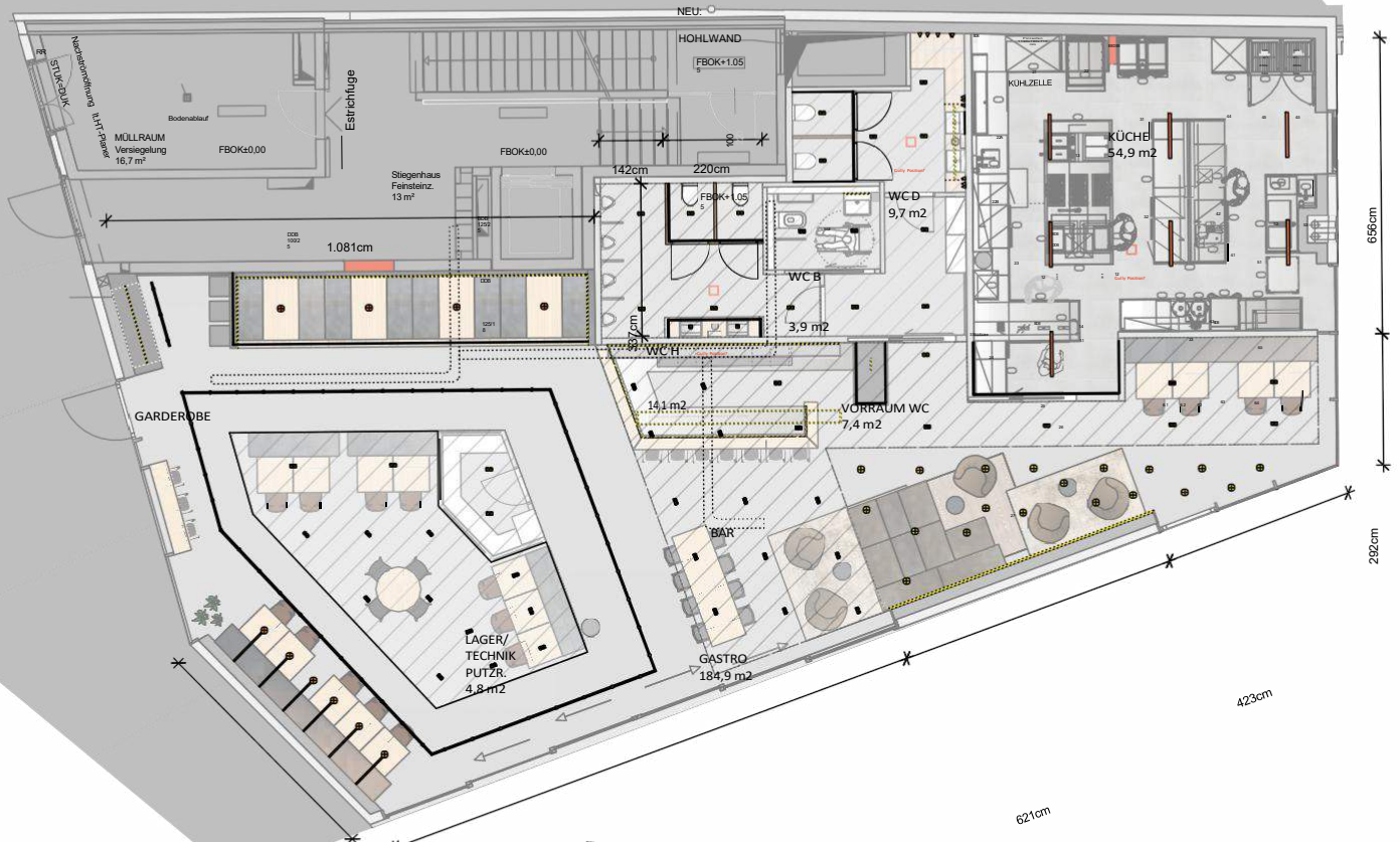
PLAN II : Lagerräume, Kühlraum, Personalumkleide, Müllraum, Eventbar im Außenbereich